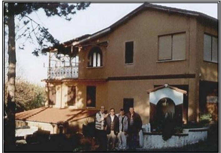
Casa "S.Rita" a Zagarolo (Roma).

Circa una decina di anni fa (1998), i padri, a causa di una diminuzione delle vocazioni, hanno deciso di cederla al GAV. Del complesso di Casa "S.Rita", fa parte una villetta a tre piani