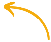
Gli operatori di Ca'Paletta